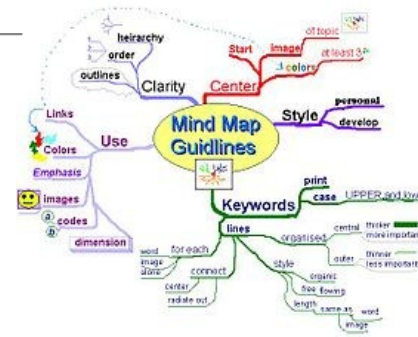
Wikipedia | Mind Map